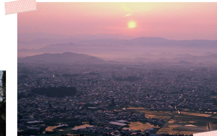
↑夕暮れ時の米沢盆地