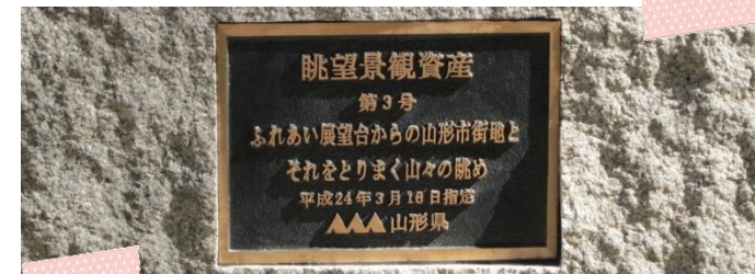
↑土台に刻まれたプレート